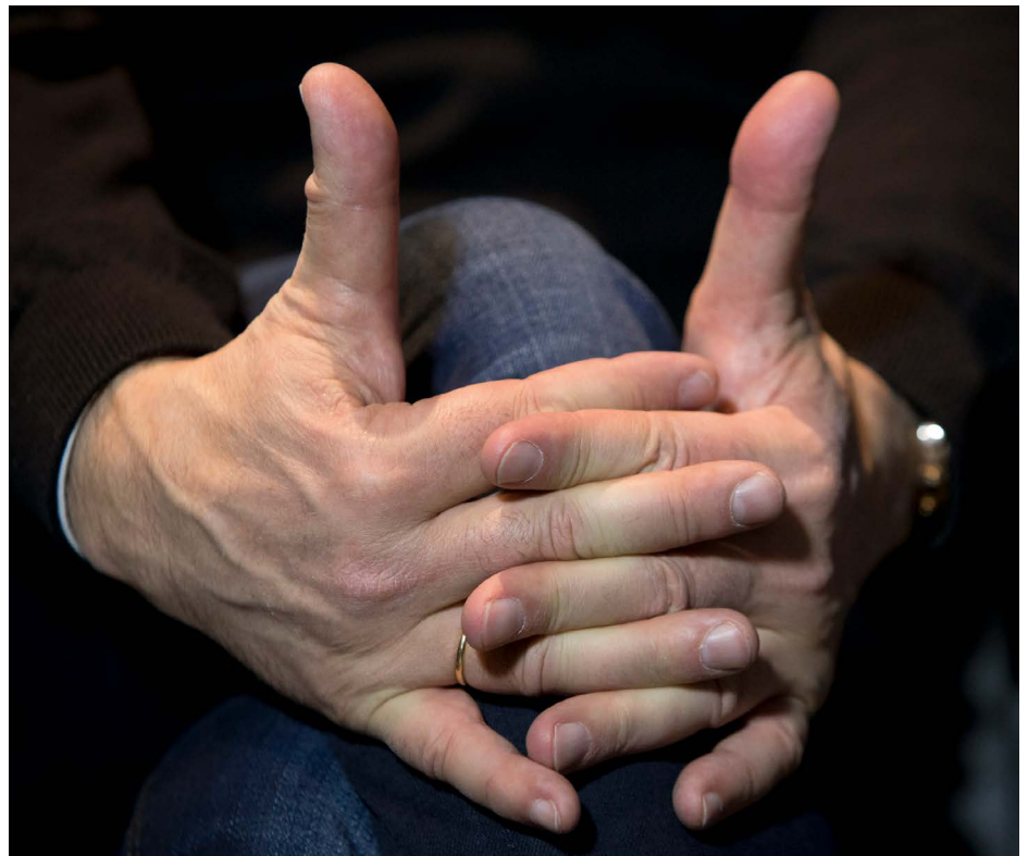
Les mans d'Arnaldo Otegi, mentre explica la seva experiència a la presó durant l'entrevista a VilaWeb.